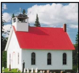
Église All Saints à Saint-Herménégilde

Pour plus d'informations : www.lieuxdeculte.qc.ca www.mrcdecoaticook.qc.ca/fr/culture-loisir/