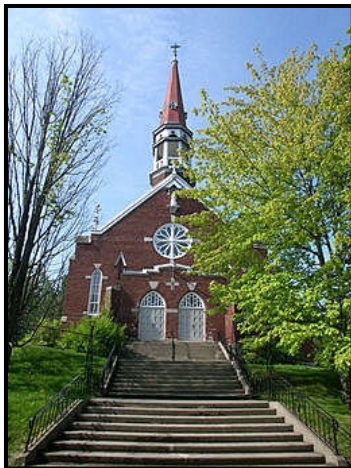
Église catholique Assomption-de-la-Bienheureuse-Vierge-Marie à Waterville