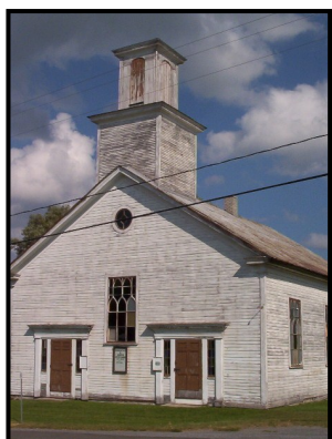
Église baptiste de Barnston