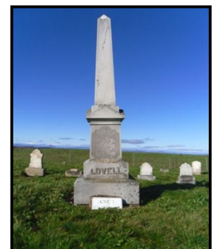
Cimetière Lovell, Coaticook

Pour plus d'informations, ou pour signaler votre intérêt à faire partie du projet, veuillez communiquer avec Edith Thibodeau, agente de développement culturel à la MRC de Coaticook au 819-849-9166 poste 28 ou par courriel à culture@mrcdecoaticook.qc.ca